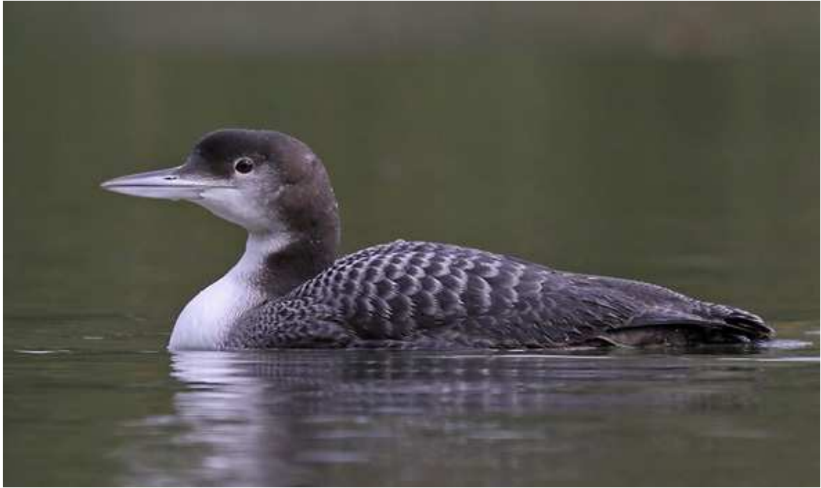
Photo 8 : Plongeon imbrin, Gavia immer , Chasteaux/Lissac (19), décembre 2010.