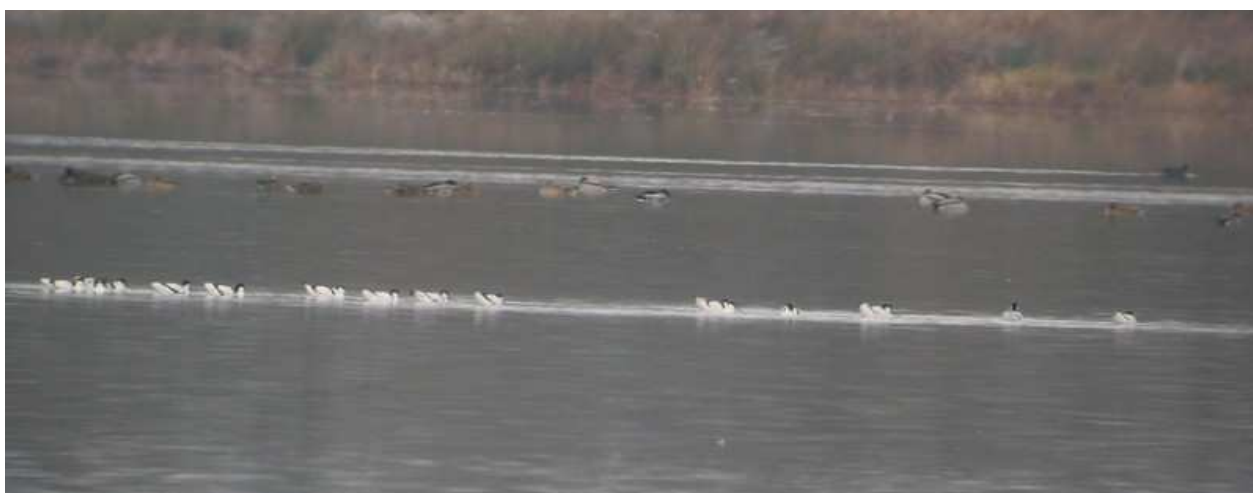
Photo 15 : Avocettes élégantes, Recurvirostra avosetta , Lussat (23), novembre 2010.

Ces observations correspondent à des oiseaux en halte migratoire. On notera que fin novembre un groupe de 99 avocettes stationnait à l'étang de Sault dans l'Allier, à 30 km de l'étang des Landes (Obs Stéphane Combaud, LPO Auvergne).